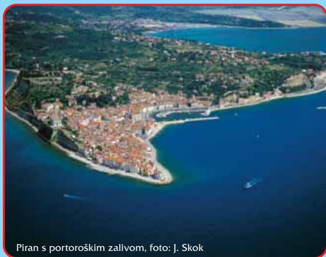
Piran s portoroškim zalivom