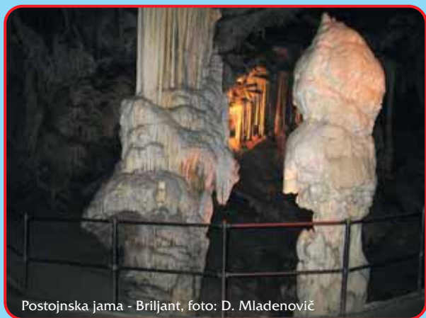
Postojnska jama - Brilljant